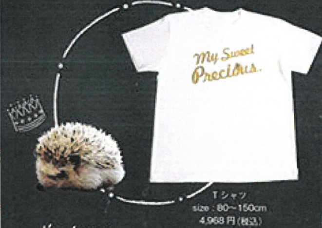
Tシャツ size : 80~150cm 4,968 円 (税込)

かわいいワンちゃんや ネコちゃんの写真を、 Tシャツやバッグに デザインします!