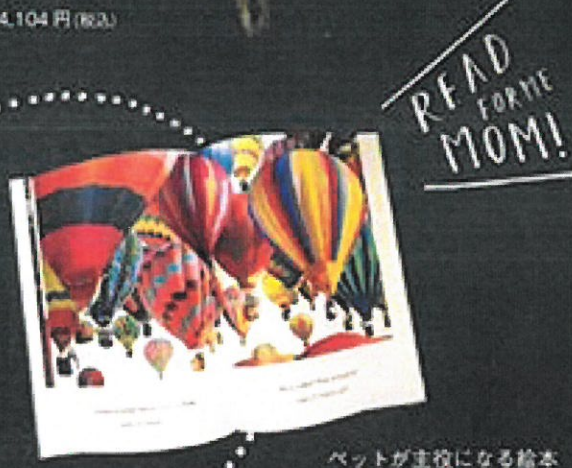
ペットが主役になる絵本 「かくれんぼ」 5,076 円 (税込)