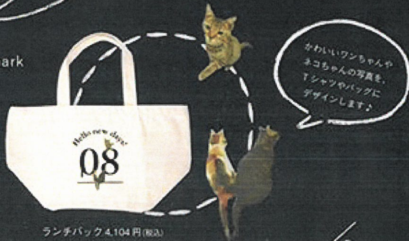
ランチバック 4,104 円 (税込)

かわいいワンちゃんや ネコちゃんの写真を、 Tシャツやバッグに デザインします!